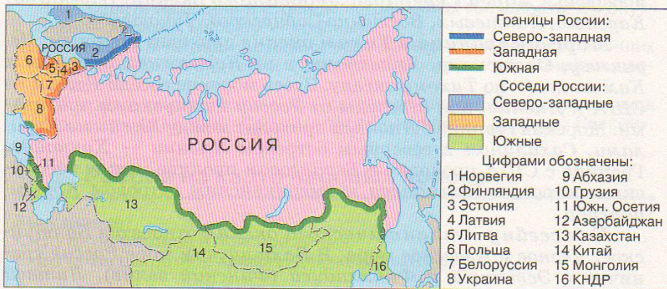
Рис. 3. Россия и страны зарубежья

Западная граница России протянулась от Балтийского до Азовского моря. Первый её участок — граница со странами Балтии ( Эстонией, Латвией ). От Москвы и Санкт-Петербурга через эти границы протянулись железные дороги — в Таллин, Ригу и Вильнюс . Из Вильнюса железные дороги направляются в Калининградскую область , отделённую от основной территории России и граничащую с Польшей и Литвой .