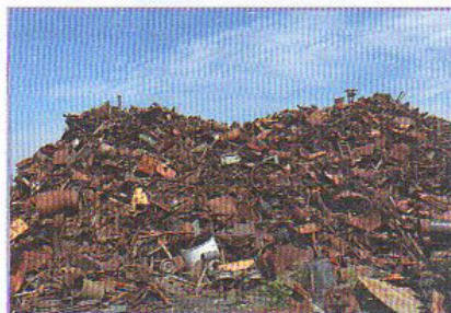
Рис. 2.14. Вторичное сырьё: а — металлолом; б — макулатура; в — пластмасса

Например, макароны — это полуфабрикат. Чтобы получить из них готовое для потребления блюдо, макароны надо отварить. Стальные трубы — это тоже полуфабрикат. Чтобы получить из труб трубопровод для перекачки нефти или газа, их надо сварить в так называемую нитку.